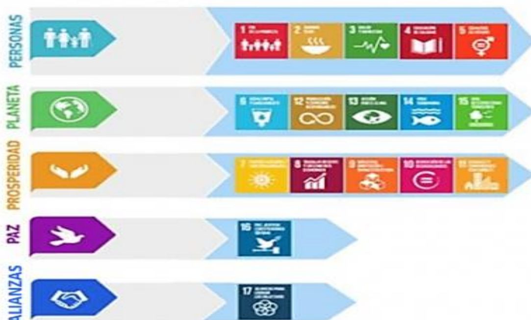
Las cinco esferas de la Agenda 2030 con sus ODS asociados a cada una (Infografía NNUU).